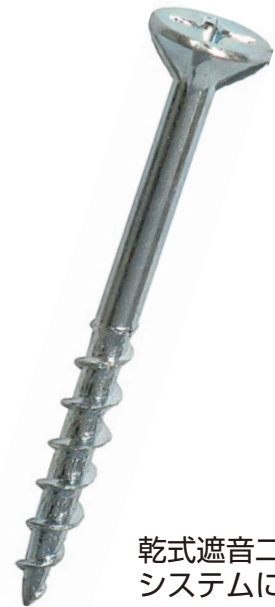
乾式遮音二重床 システムに最適